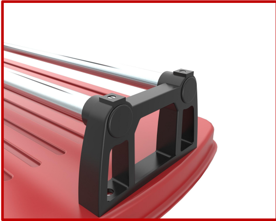
Schrauben zur Befestigung der Schienen