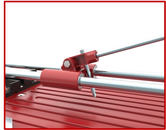
Sichtbares Schneidrädchen im Stiftdesign